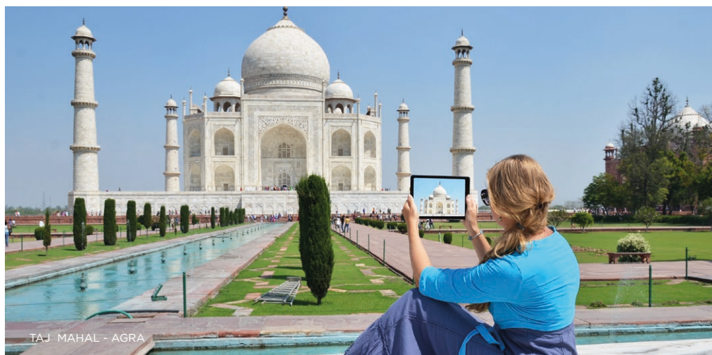
TAJ MAHAL - AGRA